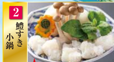
2 鱧 すき 小鍋

鱧すき小鍋をお選びいただいた場合、 基本料理の「鮑鍋」は「鮑の踊り焼き」に 変更になります。