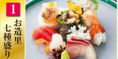
1 お造里 七種盛り

※ご指定の無い場合は 1 お造里七種盛り・2 鱧すき小鍋・ 4 熊野牛石焼きになり、 鮑は踊り焼きにさせていただきます。