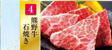
4 熊野牛 石焼き